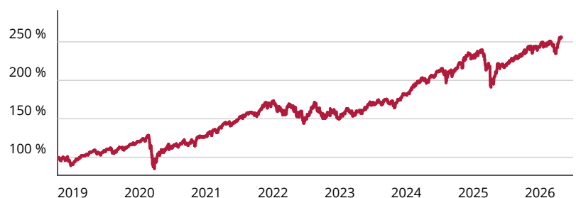
— JPMorgan ETFs - Global Research Enhanced Index Equity