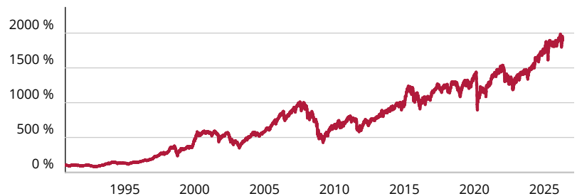
— Fidelity Funds – European Growth Fund A