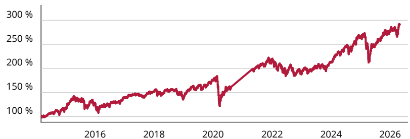
— Fidelity Funds – Fidelity Target 2045 Fund